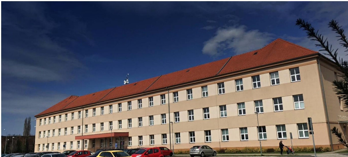
Obr. 2 – Fakulta veřejnosprávních a ekonomických studií v Uherském Hradišti

FAKULTA VEŘEJNOSPRÁVNÍCH A EKONOMICKÝCH STUDIÍ V UHERSKÉM HRADIŠTI