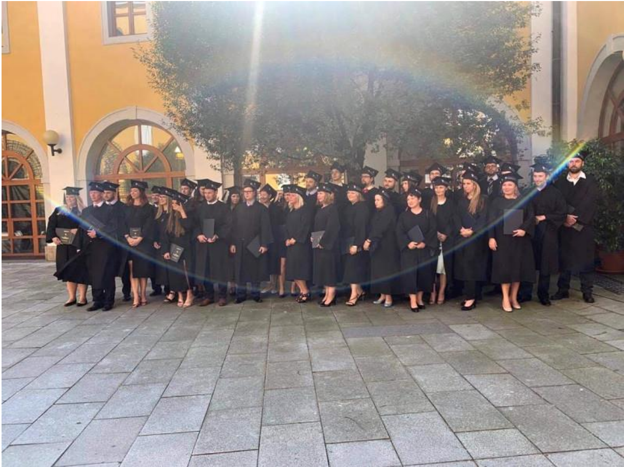
Obrázek 3 – Promoce absolventů v roce 2021

FAKULTA VEŘEJNOSPRAVNÍCH A EKONOMICKÝCH STUDIÍ V UHERSKÉM HRADIŠTI