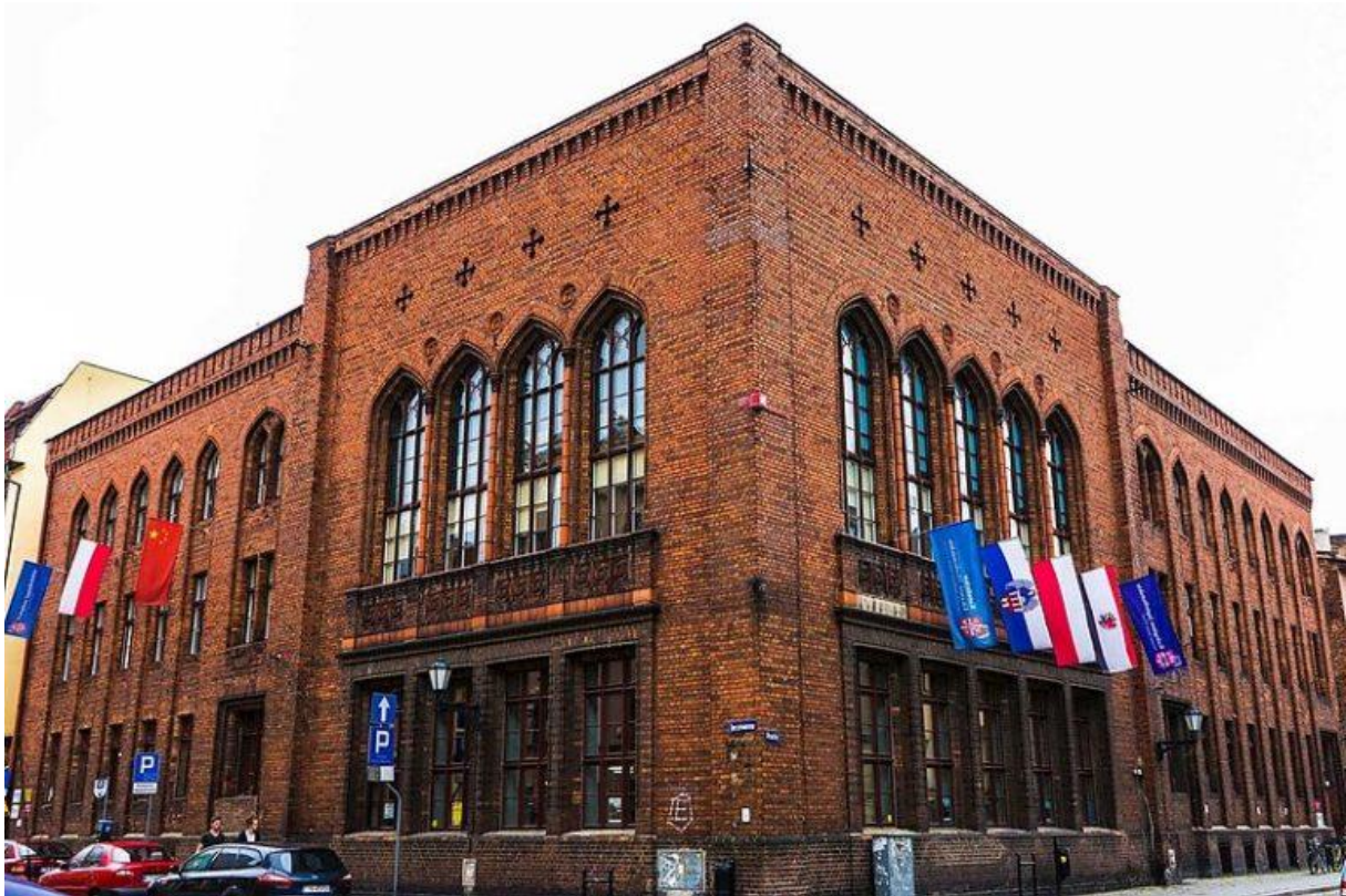
Obr. 1 Vysoká škola Jagiellońska v Toruni

Vysoká škola Jagiellońska v Toruni, pod současným názvem a programovou orientací, působí od roku 2003. Zaměřuje se na pedagogickou a tvůrčí činnost v bakalářském i magisterském studijním programu Pedagogika, a v bakalářském i magisterském studijním Správa a ekonomika. Věnuje se také realizaci profesních a manažerských studijních programů Master of Business Administration. Součástí školy je prestižní Konfuciův Institut, realizovaný v partnerství s Hubei University in Wuhan (China). Člení se na dvě fakulty – Fakultu sociálních studií a Fakultu veřejnospravních a ekonomických studií. Vysoká škola