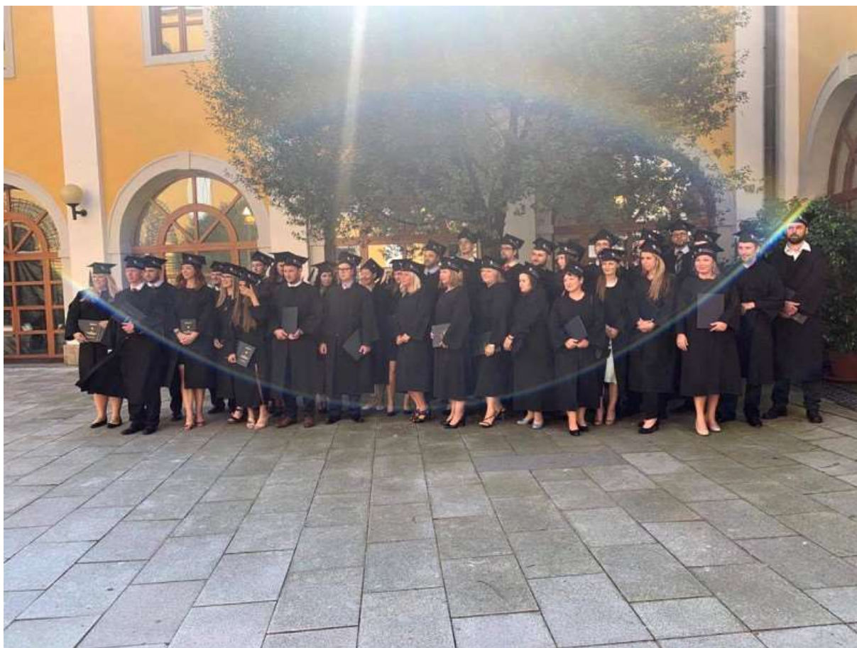
Obrázek 3 – Promoce absolventů v roce 2020

Vzhledem k 100% zaměstnání našich absolventů nebyly průzkumy na uplatnitelnost absolventů realizovány, protože by byly obsolentní.