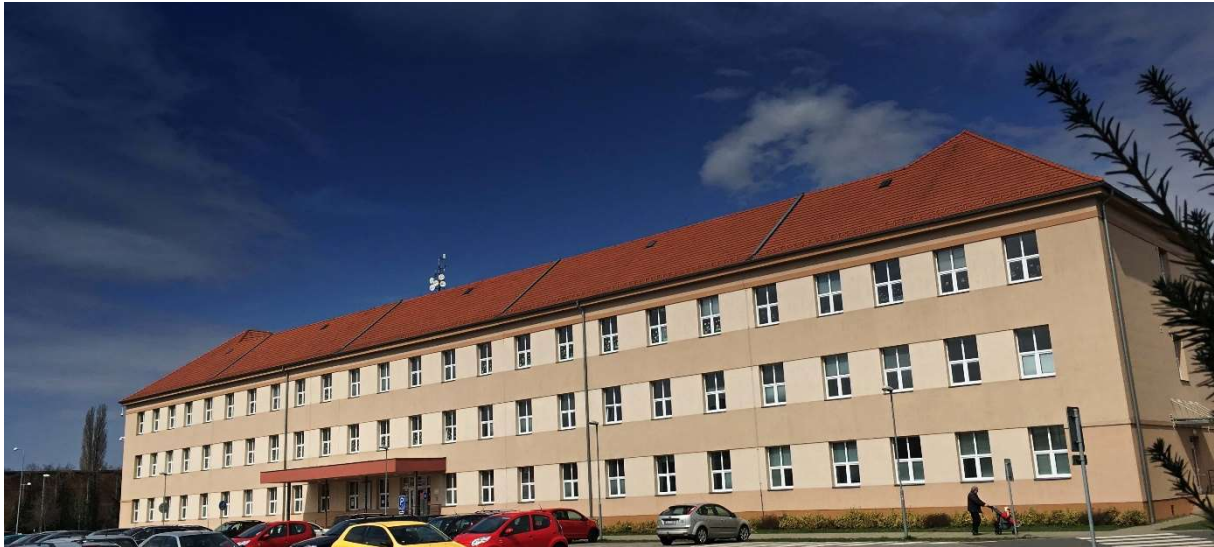
Obr. 2 – Fakulta veřejnosprávních a ekonomických studií v Uherském Hradišti

FAKULTA VEŘEJNOSPRÁVNÍCH A EKONOMICKÝCH STUDIÍ V UHERSKÉM HRADIŠTI