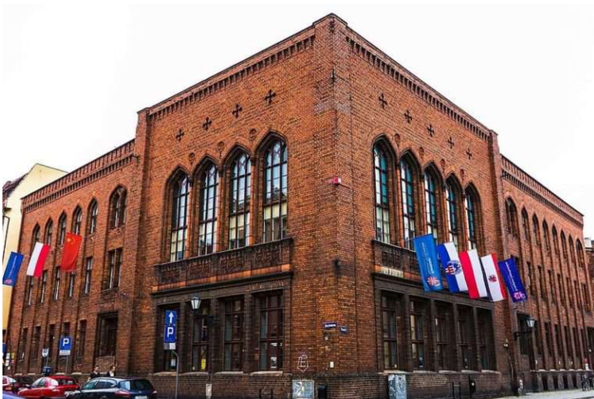
Obr. 1 Vysoká škola Jagiellońska v Toruni

Vysoká škola Jagiellońska v Toruni, pod současným názvem a programovou orientací, působí od roku 2003. Zaměřuje se na pedagogickou a tvůrčí činnost v bakalářském i magisterském studijním programu Pedagogika, a v bakalářském i magisterském studijním Správa a ekonomika. Věnuje se také realizaci profesních a manažerských studijních programů Master of Business Administration. Součástí školy je prestižní Konfuciovův Institut, realizovaný v partnerství s Hubei University in Wuhan (China). Člení se na dvě fakulty – Fakultu sociálních studií a Fakultu veřejnosprávních a ekonomických studií. Vysoká škola Jagiellońska sídlí v objektu, ve kterém od 18. století do současnosti probíhají nepřetržitě vysokoškolská