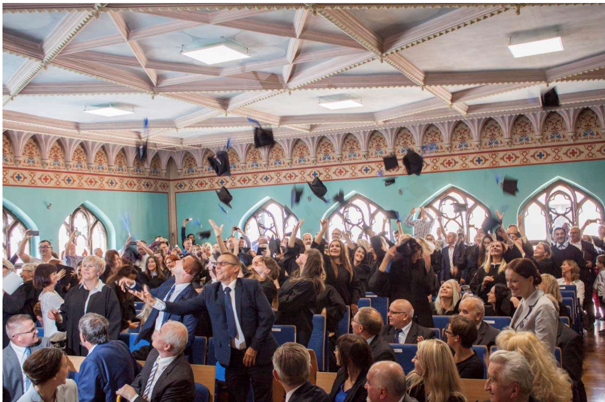
Obr. 4 – Promoce absolventů Vysoké školy Jagielloňské v Toruni

V rámci přijímacího řízení jsou přijímací zkoušky realizovány formou vyjádření zájmu o studium. Přijímací řízení a přijímací zkoušky jsou realizovány vlastními zdroji.